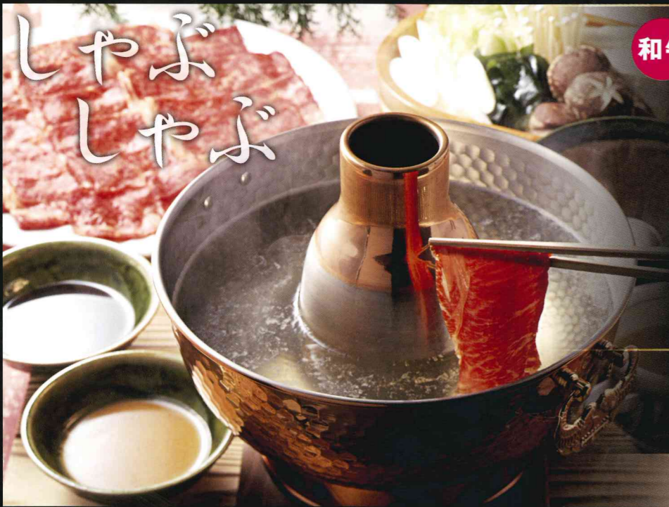
※仕入れ状況により内容が変更になる場合がございます。写真はイメージです

1年の締めくくりとして、その年を振り返り労をねぎらう「忘年会」と、新しい年を迎え年の始まりを祝う「新年会」。どちらもホテルサンプラザが皆様の大切な節目を演出いたします。一流シェフが腕を振るうホテル自慢の彩り豊かな料理を、洗練された宴会場でゆっくりとお楽しみください。