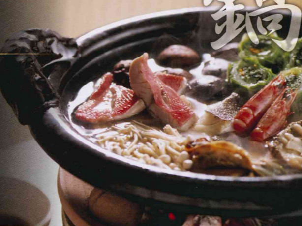
※仕入れ状況により内容が変更になる場合がございます。写真はイメージです